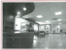
■佈置得像家裡的客廳的醫護站

安寧療護的目的，在減輕癌症病患其身體的各種不適症狀，並同時提供精神支持及靈性上的照顧。希望讓病人能在剩餘的生命中，得到較好的生活品質以維持其生命尊嚴，平靜地走完人生終點。同時也協助家屬突破傳統不易接受死亡的觀念，消除恐懼坦然面對臨終的事實，共同支持使彼此之間有好的溝通，並為臨終家屬提供哀傷與善後輔導，讓生死兩無憾。