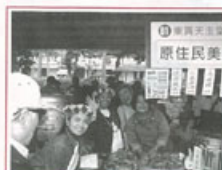
▶東興天主堂提供原住民美食