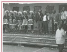
▶富岡巴登俱文發展協會演進而來，演出阿美族歌舞