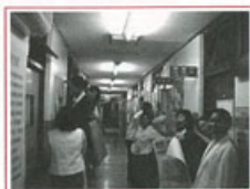
▶醫院員工一起來布置「時光走廊」，讓民眾走過聖母醫院的42年時光中

第一家在台東成立的安寧病房，就如同艾珂瑛修女是在台東第一位作居家照護的護理人員，我們不是故意去爭第一，而是看到病患從內心深處對醫療照護的渴望。