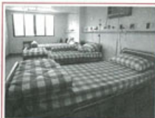
■像臥室的病房一隅