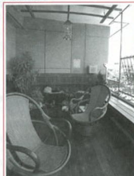
▶安寧病房外紓緩心情的陽台