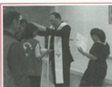
▶花蓮教區黃兆明主教主持安寧志工巡迴禮