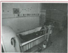
■水療室洗澡機，可減輕病患疼痛

而台東是台灣唯一沒有安寧病房的縣市，根據民國91年統計資料顯示，台東第一大死亡原因惡性腫瘤死亡人數有461人，佔死亡人數比率20.48%。同樣享有健保資源與重大傷病卡的癌症居民，常常舟車勞頓地南北奔波就醫，連帶發生的是照顧者體力、時間與經濟壓力種種問題，如交通往返時間與費用、住宿費、及照顧者身心憔悴等等。鑑於台東民眾需要，聖母醫院積極打造「台東第一間安寧病房」，連結運作一年多的居家安寧療護服務，提供安寧緩和和醫療。目前聖母的安寧病房設置有一人房一間、二人房二間及三人房三間；而專業的醫療團隊，則是由家醫科醫師及護理人力共十人、助理員三人、專任社工人和牧靈小組三人。同時針對癌症末期病患常見的不適情形，如疼痛、呼吸困難、噁心嘔吐等作完善的評估及處理外，另提供芳香療法、淋巴水腫按摩及按摩浴缸的使用等，以提供舒適高品質的服務。另專業的安寧團隊小組，專人解決心理或社會經濟之問題，並有家服務員或義工的協助及陪伴，讓家屬得以獲得身心的紓解。除了安寧病房所提供的服務內容之外，同時配合社工人員運用社會工作專業知識協助病患及家屬處理與疾病有關的社會、心理、家庭、經濟等問題。以及牧靈人員從心靈方面的角度切入，在靈性的層面上啟發病患及家屬的潛能，增進他們疾病適應能力，從而促進醫療效果，提升醫療服務層面品質。