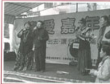
▶台東市賴坤成市長主持義賣活動