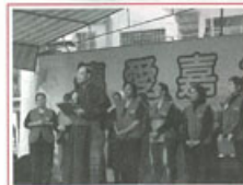
▶黃兆明主教主持活動開幕