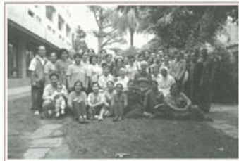
▶ 依依不捨想念艾修女

跟著艾修女三十日的居家服務，是天主給我的一份禮物，更不知醫院在十年後會增設安寧病房，需要增加牧靈人員。當時鄭修女也是現任院長，問我願不願意做牧靈工作？起先，也因為好奇便答應，但是說真的，醫院牧靈要服務的方向，對我來說是一片霧海，毫無方針，僅有的就是和艾修女三十日居家服務所學習來陪伴病人的態度。