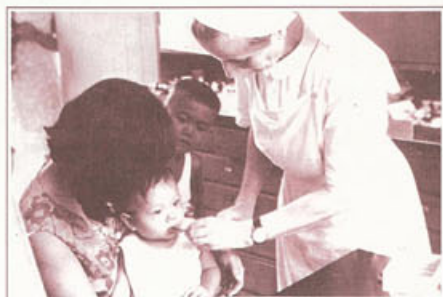
▶「凡你們對我這些最小兄弟中的一個所做的，就是對我做的。」