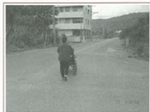
▶走出戶外終於不再只是幻想了

明天就是我們團隊照顧他滿一年的日子，記得去年第一次的拜視，他的妻子擔心我們說錯話，怕我們影響個案情緒，不願手上還拿著菜刀，一邊削皮，一邊回應我們。說話的模樣、謹慎的表情，讓我迫切想知道家屬擔心的原因。了解之後，原來他因為癌症造成的轉移，在三年前進行脊髓手術後，下半身無法正常解便解尿，無法正常活動及失去反射，