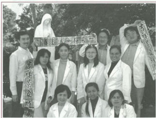
▶醫護組向大家拜新年