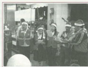
▶「聽哪！天使高聲唱，榮耀都歸新生王……」