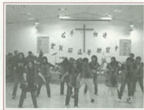
▶聖誕晚會活力大家一起來