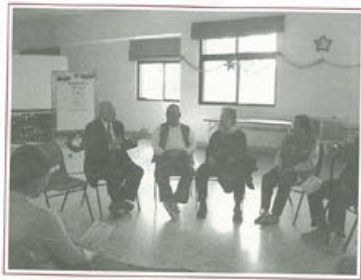
▶林瑞祥教授與棒棒糖病友團體的愛心約會