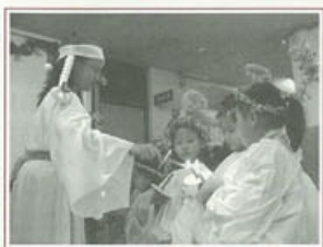
▶小天使佳音隊傳遞愛的福音

「愛」，是基督信仰的核心，也是耶穌基督降生的目的。聖母醫院願每一位朋友在這個聖誕節，與耶穌這位生命的主相遇，讓祂的愛與能力進入您的生命中，讓基督展開屬於您人生新的開始。