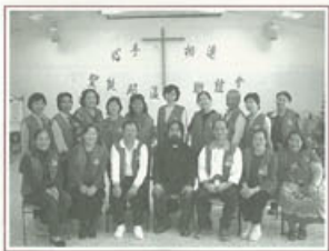
▶可愛又有愛心的聖母醫院志工隊