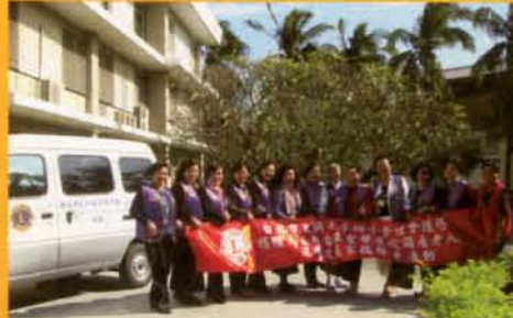
大同女子獅子會親自蒞臨本院參加贈車儀式