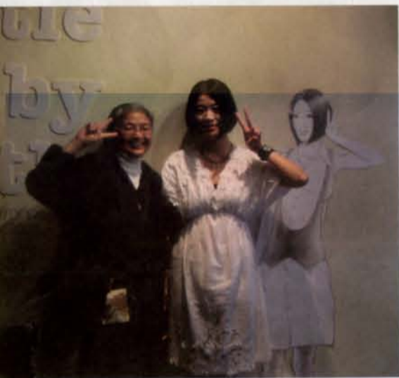
大家都說沒見過這麼活潑的修女