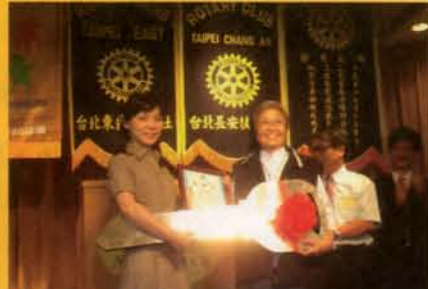
長安扶輪社致贈醫療車